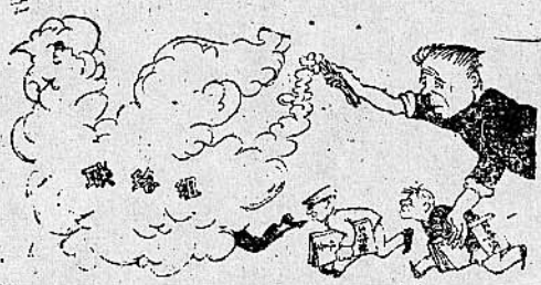
3. 黑省委，土皇帝，镇压革命费心机。派出特务“工作组”，打着破烂“联络旗”。