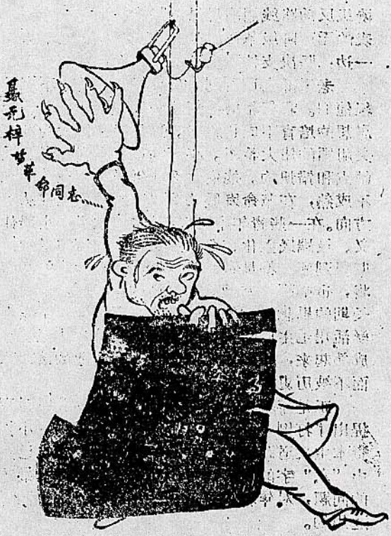
2. 一声春雷震天响，卫馐失魂慌慌张，屁滚尿流冒臭汗，伸出黑手想遮天！