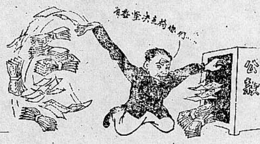
8. 开国库，抛公款，瞎狗拨拉黑算盘，大搞反革命经济主义，一股妖风想变天！