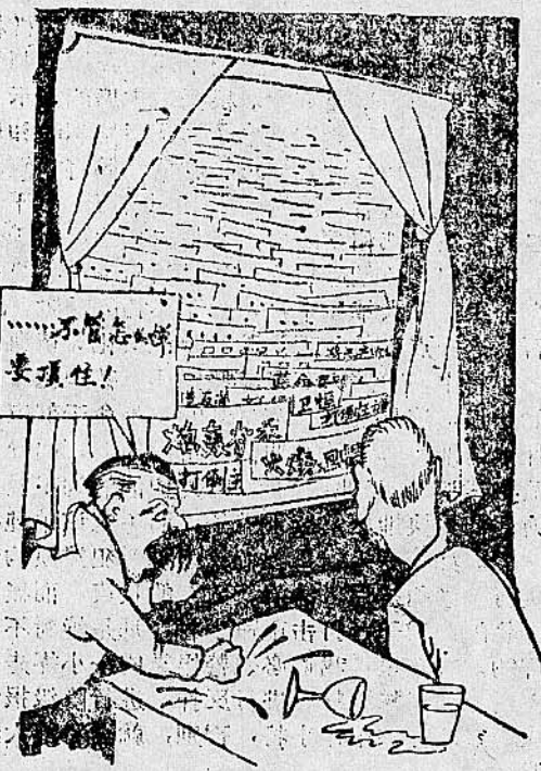
5. “炮轰省委”“火烧卫馐”，革命烈火熊熊。“……不管怎么要顶住！”卫馐妄想保狗命！