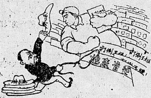
4. “野心家”“伸手派”，卫记“特产”大拍卖。革命闯将挥巨臂，砸烂卫馐狗脑袋！