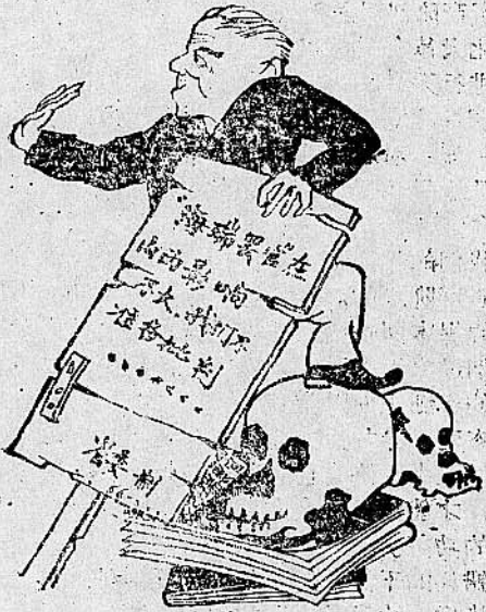
1. “学术批判”， 《二月提纲》 卫记黑店“巧”装扮， 拚了狗命保黑帮！