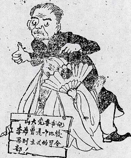
6. 狡狐藏刀披裙衫，斯文扇后阴风翻，主子奴才演双簧，黔驴技穷惨！惨！惨！