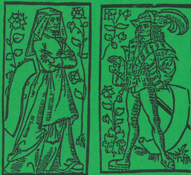
Ill. tirée d'une édit. des Quinze joyes de mariage (Jean Tréperel, Paris, 1499).