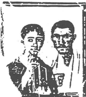
Portrait de Procuste et sa femme. Première de l'annuel (Album National, Nancy)

Ceux ou celles d'entre vous qui choisiraient de faire les exposés 1 et 2 ne pourront pas choisir le sujet de dissertation no. iii.