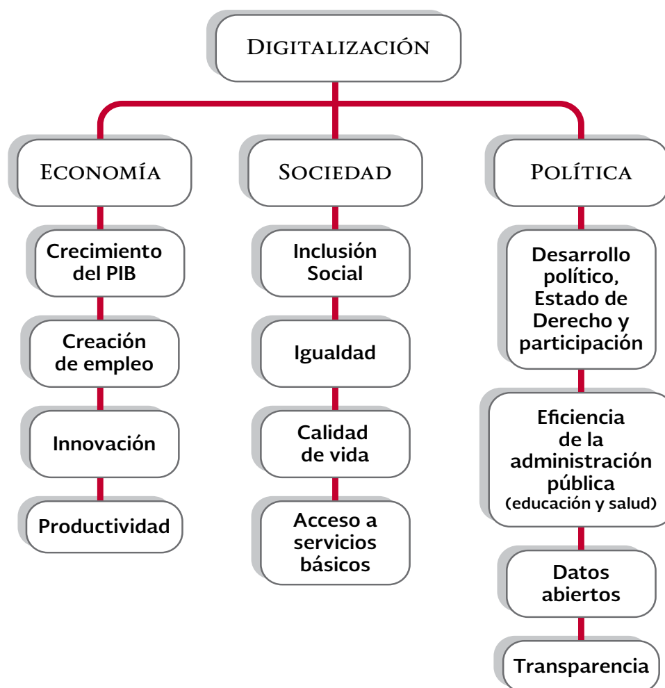
Figura 1. Impactos Multidimensional de la Digitalización